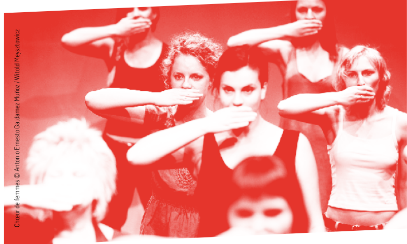
Chœur de femmes