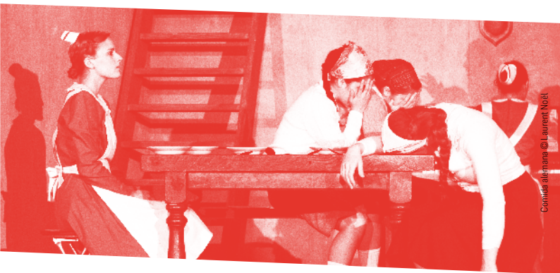
Comida alemana