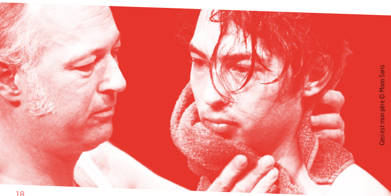
Ceci est mon père © Moon Sarris