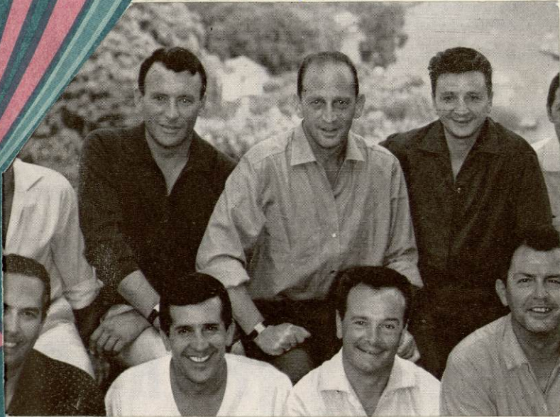
11. 20 mai

à proximité de votre domicile il y a toujours une succursale de la