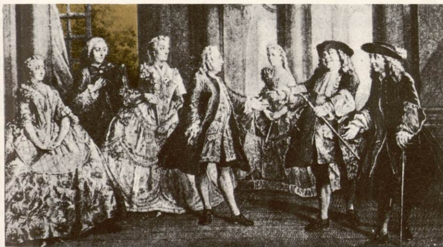
COMÉDIENS DU XVIII e SIÈCLE Gravure de Dupuis d'après Lancret

La comédie sentimentale apparue vers 1725 en Angleterre et qui fournissait l'exemple de la vertu toujours récompensée, prenait ses premières formes en France dans les essais de PIRON, tel « Le Fils Ingrat » (1723). Ces premières formes devaient trouver leur accomplissement dans le sérieux et la vertu avec les pièces de NIVELLE DE LA CHAUSSÉE (1692-1754), véritable créateur du drame bourgeois, qui imposa à l'appréciation des spectateurs sa « morale » apologie en quelque sorte de tout ce qui est modéré. Désormais, famille et mariage seront opposés aux habitudes licencieuses de la noblesse ; une nouvelle « vertu » se définira progressivement dont la dignité et l'honnêteté seront les bases.