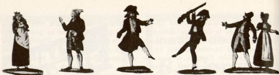
SCÈNES DU « RÉVEIL DE LA COURTILLE ». Comédie pantomime de la période révolutionnaire.