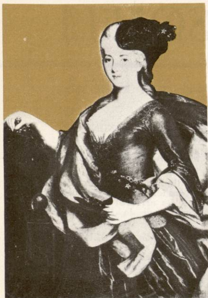
GIANNETTA BENOZZI DITE « LA SYLVIA » Par F. de Troy - Collection du duc de Portland.

C'est pour l'actrice Sylvia que Marivaux a écrit ses chefs-d'œuvre comme « La Double Inconstance » (1723), « Le Jeu de l'Amour et du Hasard » (1730), « Les Fausses Confidences » (1737). Les héroïnes de Marivaux imposent à l'artiste qui les interprète une personnalité très particulière.