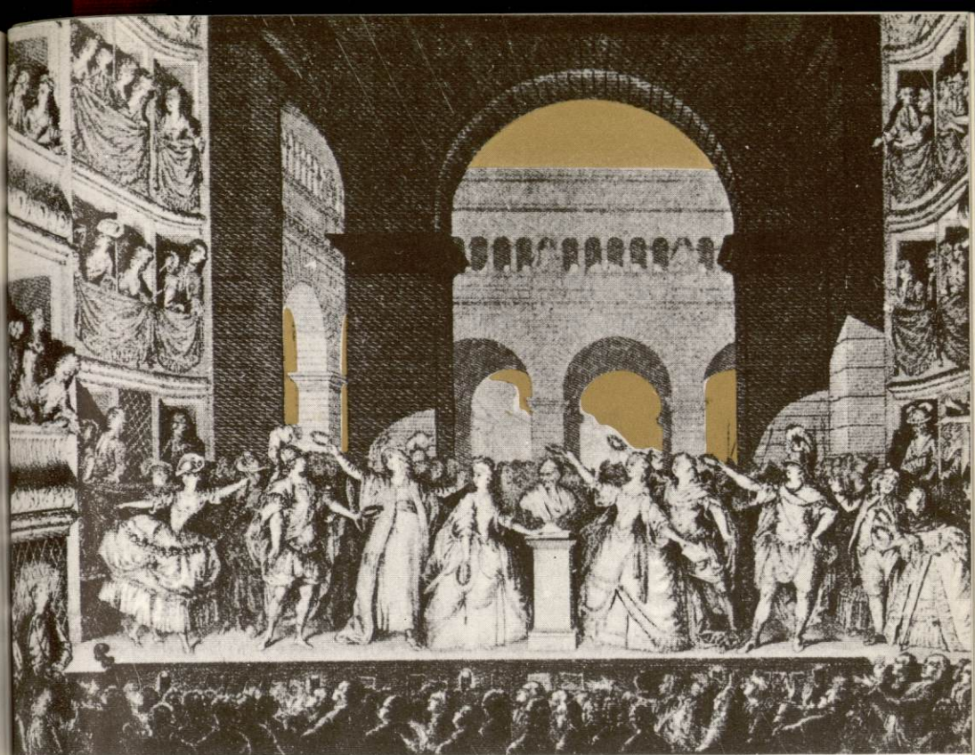
COURONNEMENT DU BUSTE DE VOLTAIRE AU COURS D'UNE REPRÉSENTATION D'IRÈNE AU THÉÂTRE FRANÇAIS (1778). (Estampe de Laquillermie, d'après Moreau le Jeune).

dramatique et n'a agi qu'indirectement sur celui-ci par ses critiques et ses polémiques. Cependant, de 1718 (Œdipe) à 1760 (Tancrède), il a contribué par son goût des émotions sublimes et des moyens scéniques, à la naissance d'une conception du drame qu'au siècle suivant les romantiques s'appliqueront à porter à son sommet. Car le drame dit historique avec sa « couleur locale » est venu de là.