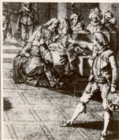
LE MARIAGE DE FIGARO Scène du procès du troisième acte

Sa vie aventureuse est nourrie d'entreprises extraordinaires, de fortunes et de ruines successives, de procès, de polémiques, de contradictions qui ne l'embarrassent point, d'initiatives décisives comme la fondation de la Société des Auteurs Dramatiques. Il est, comme Voltaire, irrespectueux, insolent, attaque tout : les mœurs, la justice, la politique royale ; se dresse en général contre « un ordre de choses où rien ni personne n'est à sa place ». Pour la première fois sur la scène française, le rire est devenu révolutionnaire avec BEAUMARCHAIS.