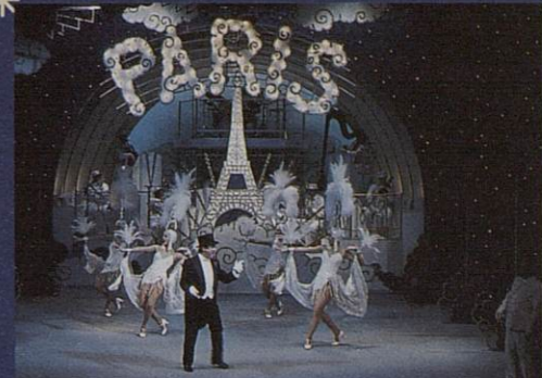
Photos réalisées lors des représentations de décembre 96