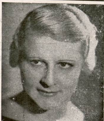
ANNETTE LAJON Grand Prix du Disque Pathé 1936

Succursale de - LYON - 35, rue de Marseille