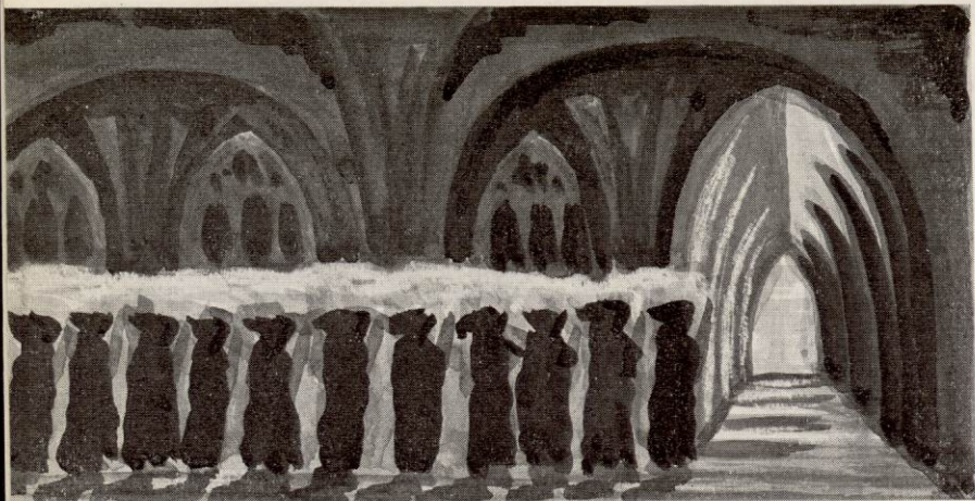
LES PROCESSIONS DES MOINES EN ROBE DE BURE