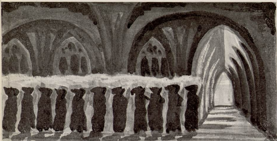
LES PROCESSIONS DES MOINES EN ROBE DE BURE