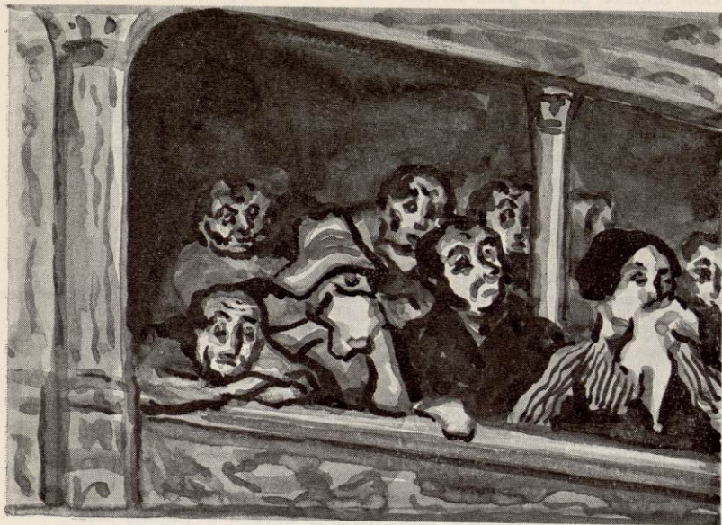
LA VISITE DE LA CLASSE LABORIEUSE

se produisaient les grands de la profession comme Talma et Rachel et où avaient lieu toutes les réceptions officielles.