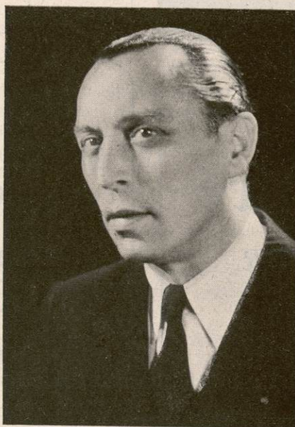
Louis JOUVET

29, RUE FRANÇOIS-GARCIN (ANGLE 84, R. Tél. Moncey 48-06 LYON PART - DIEU).