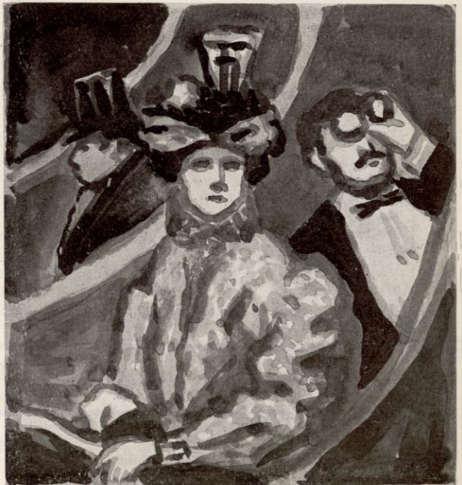
LA VISITE DE LA SOCIÉTÉ PRIVILÉGIÉE