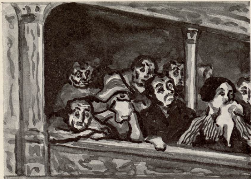
LA VISITE DE LA CLASSE LABORIEUSE

se produisaient les grands de la profession comme Talma et Rachel et où avaient lieu toutes les réceptions officielles.