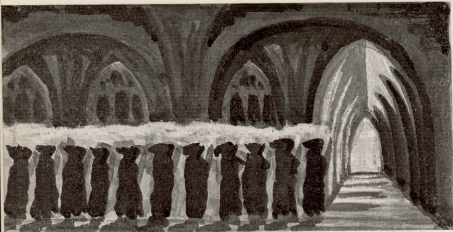
LES PROCESSIONS DES MOINES EN ROBE DE BURE