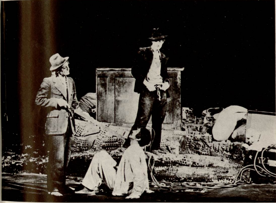
Une scène de " IL EST ARRIVÉ "

Réalise BERTIN Avec LE COULTRE Ecran JOCHAY