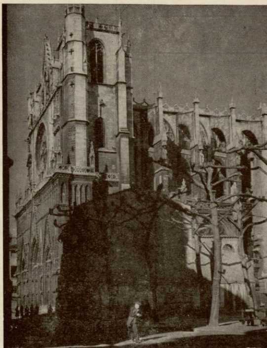
Primatiale Saint-Jean et Manécanterie

VUES DE LYON SELECTIONNEES EN 14 CLICHES - N° 13