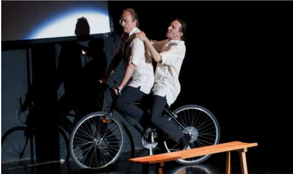
Ca va