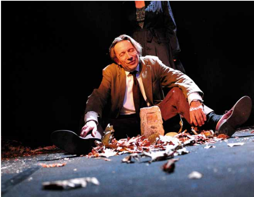
Verticale de fureur - © Emile Zeizig