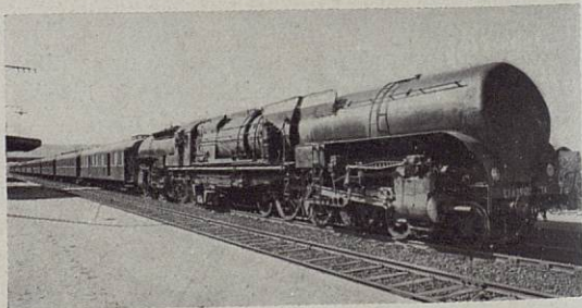
DES TRAINS CONFORTABLES

vous offre des moyens MODERNES de TRANSPORT