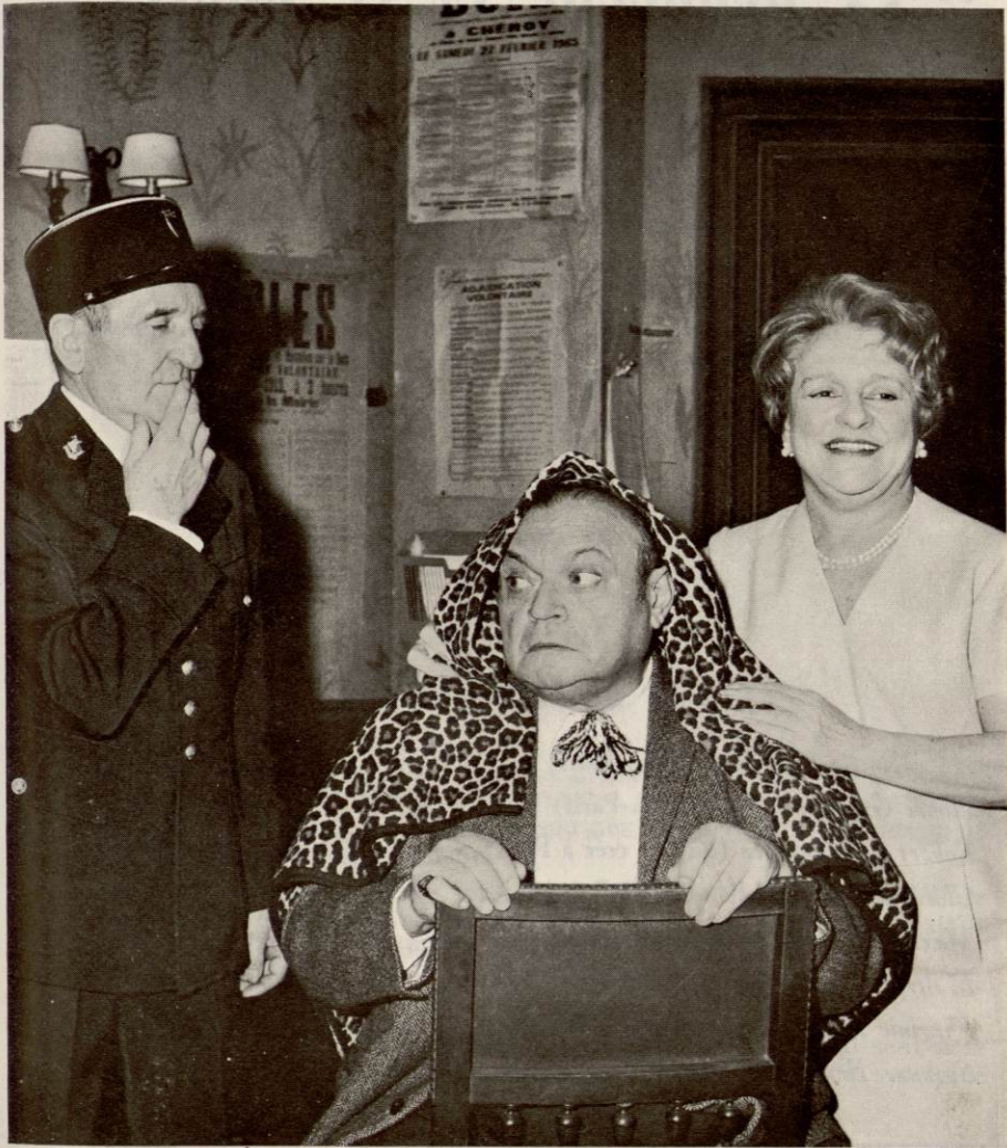
Une scène de "LA PERRUCHE ET LE POULET"