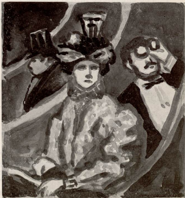
LA VISITE DE LA SOCIÉTÉ PRIVILÉGIÉE