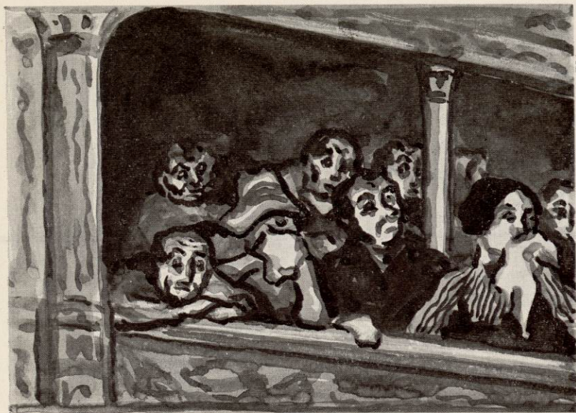
LA VISITE DE LA CLASSE LABORIEUSE

se produisaient les grands de la profession comme Talma et Rachel et où avaient lieu toutes les réceptions officielles.