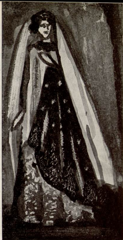
ELLE FUT CÉLÈBRE SOUS LE NOM DE RACHEL

aurait pu être célèbre si l'assassin ne s'était nommé Jobard ; avec un nom pareil, il ne pouvait pas passer à la postérité. Il n'eut même pas la satisfaction de voir son désir de mourir exaucé : les juges ne le condamnèrent qu'à la détention perpétuelle.