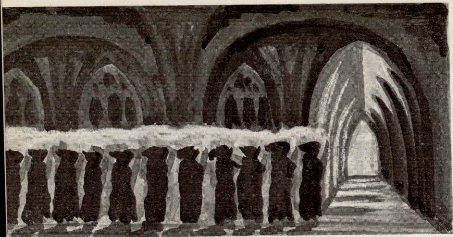
LES PROCESSIONS DES MOINES EN ROBE DE BURE