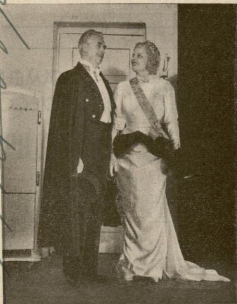
Elvire POPESCO et Victor FRANCO dans une scène de "TOVARITCH"

119, RUE PAUL-BERT • LYON (PLACE GARIBALDI) - TRAMS 25 ET 28