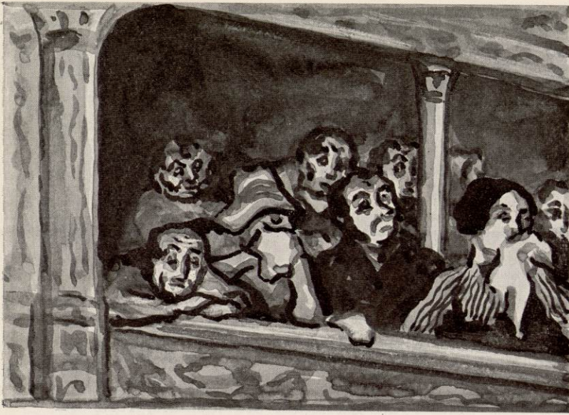
LA VISITE DE LA CLASSE LABORIEUSE

se produisaient les grands de la profession comme Talma et Rachel et où avaient lieu toutes les réceptions officielles.