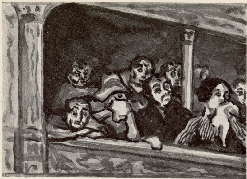
LA VISITE DE LA CLASSE LABORIEUSE

se produisaient les grands de la profession comme Talma et Rachel et où avaient lieu toutes les réceptions officielles.