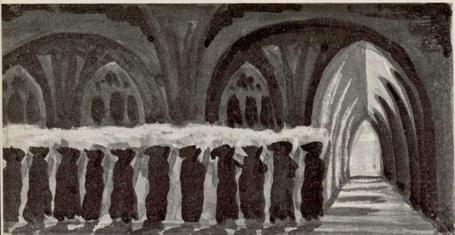
LES PROCESSIONS DES MOINES EN ROBE DE BURE