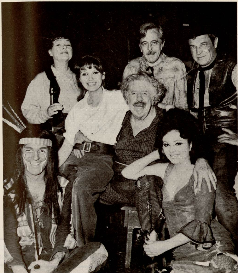
Une scène de « DU VENT DANS LES BRANCHES DE SASSAFRAS »