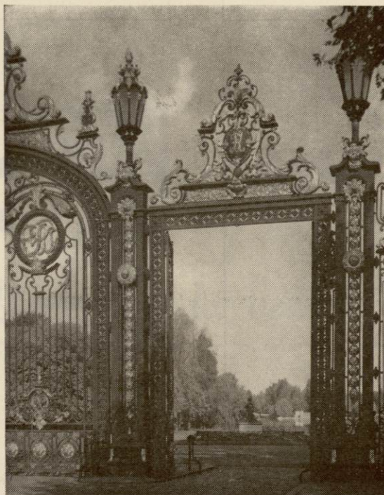
Les grilles du parc de la Tête d'Or

VUES DE LYON SELECTIONNEES EN 14 CLICHES - N° 7