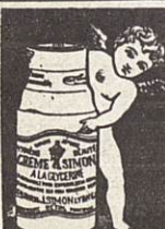
PHOTO 16, rue des Archers LYON