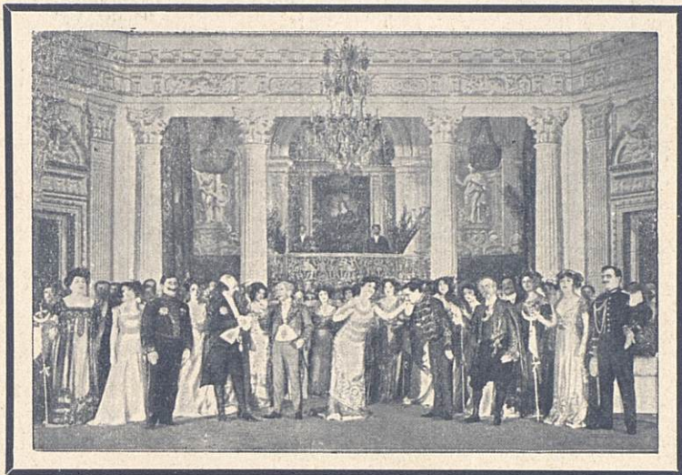
Un bal à l'Ambassade de Marsovie.

L'ACTE se passe dans les salons de l'ambassade de Marsovie, à Paris, durant un bal donné par l'ambassadeur Popoff pour fêter l'anniversaire du prince régnant. Nadia, la femme de l'ambassadeur, y « flirte » avec Camille de Coutanson, jeune officier français, dont elle repousse assez mollement les avances.