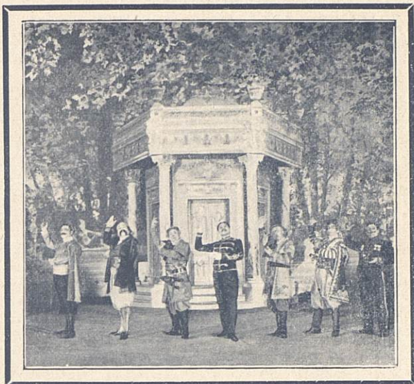
Garden-Party chez Missia Palmieri.

P OUR fêter à son tour le prince régnant de Marsovie, Missia donne une fête dans le parc de son hôtel et nous y retrouvons les mêmes invités qu'au premier acte. Danilo continue à ne pas vouloir épouser Missia et Popoff s'en inquiète, car il s'imagine que la Veuve veut épouser Camille de Coutanson, ne se doutant pas de l'intrigue de ce dernier avec Nadia, sa femme.