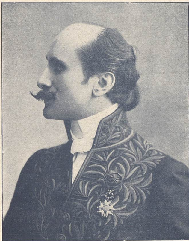
M. Edmond ROSTAND, de l'Académie Française

DÉCORS, COSTUMES, ACCESSOIRES du Théâtre de la Porte-St-Martin