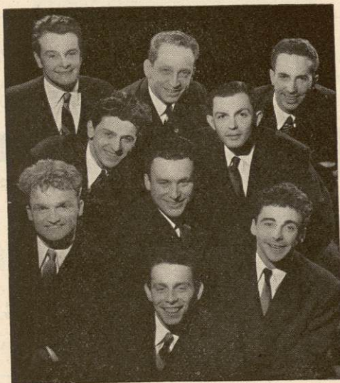
Les Compagnons de la Chanson