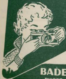
Photo et Cinéma FERONT REVIVRE VOS VACANCES