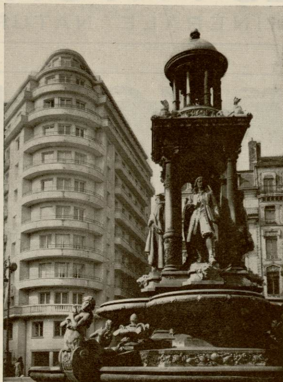
Fontaine et building sur la place des Jacobins

VUES DE LYON SÉLECTIONNÉES EN 14 CLICHÉS - N° 3