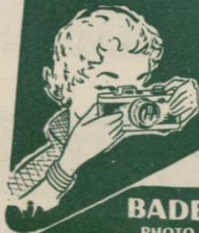
Photo et Cinéma FERONT REVIVRE VOS VACANCES