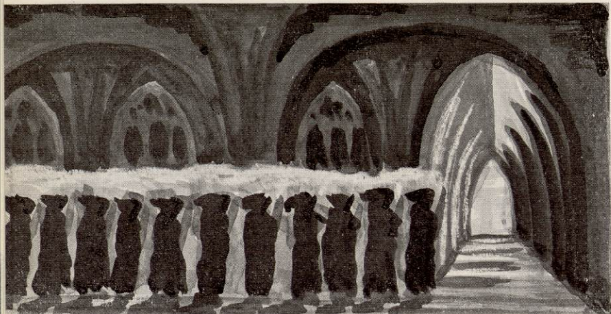
LES PROCESSIONS DES MOINES EN ROBE DE BURE