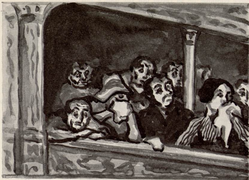
LA VISITE DE LA CLASSE LABORIEUSE

se produisaient les grands de la profession comme Talma et Rachel et où avaient lieu toutes les réceptions officielles.