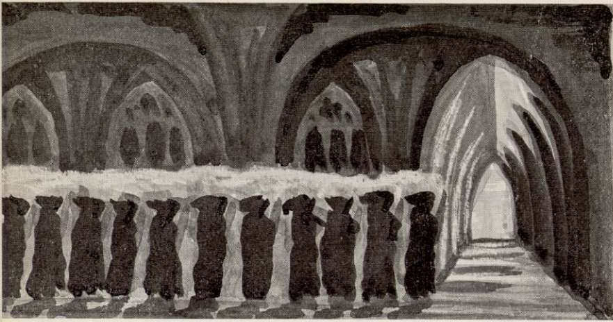
LES PROCESSIONS DES MOINES EN ROBE DE BURE