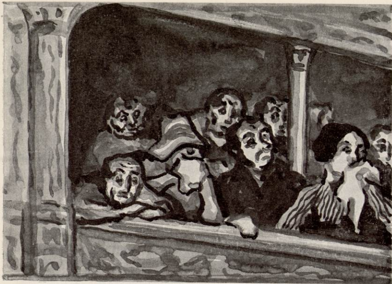
LA VISITE DE LA CLASSE LABORIEUSE

se produisaient les grands de la profession comme Talma et Rachel et où avaient lieu toutes les réceptions officielles.