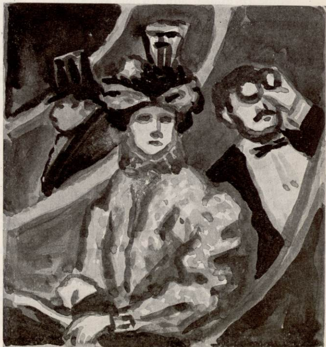
LA VISITE DE LA SOCIÉTÉ PRIVILÉGIÉE