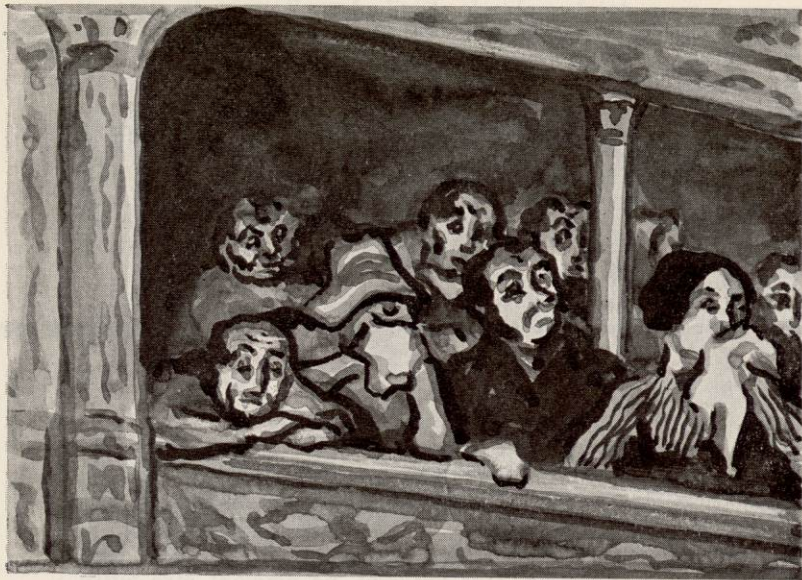
LA VISITE DE LA CLASSE LABORIEUSE

se produisaient les grands de la profession comme Talma et Rachel et où avaient lieu toutes les réceptions officielles.