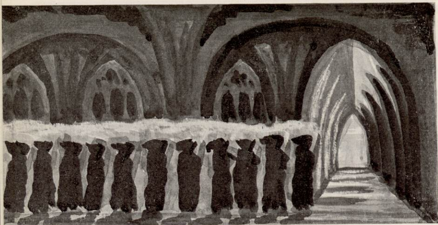
LES PROCESSIONS DES MOINES EN ROBE DE BURE