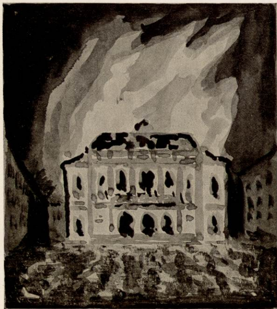
LE FEU AVAIT PRIS NAISSANCE DANS LE POSTE DES POMPIERS