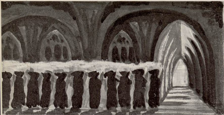
LES PROCESSIONS DES MOINES EN ROBE DE BURE