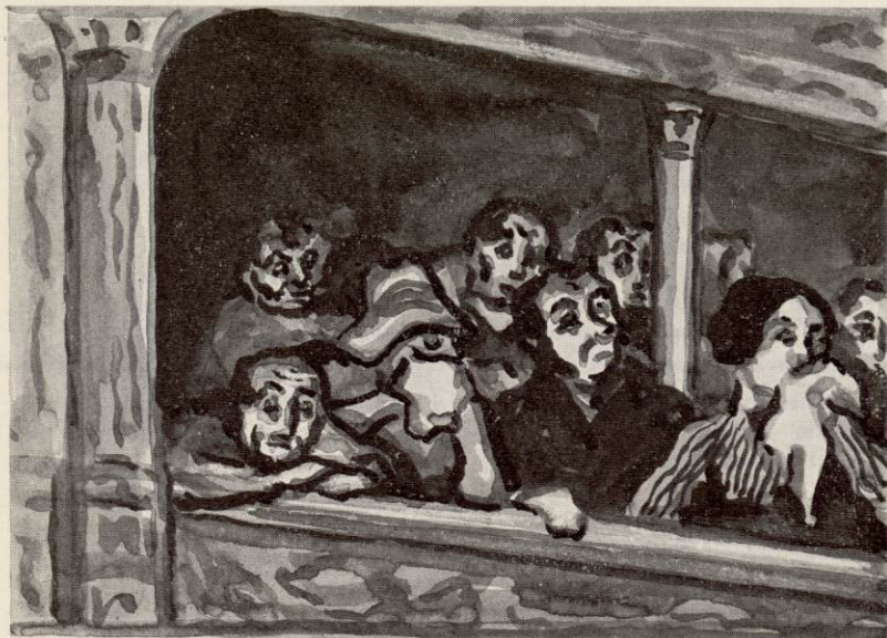
LA VISITE DE LA CLASSE LABORIEUSE

se produisaient les grands de la profession comme Talma et Rachel et où avaient lieu toutes les réceptions officielles.