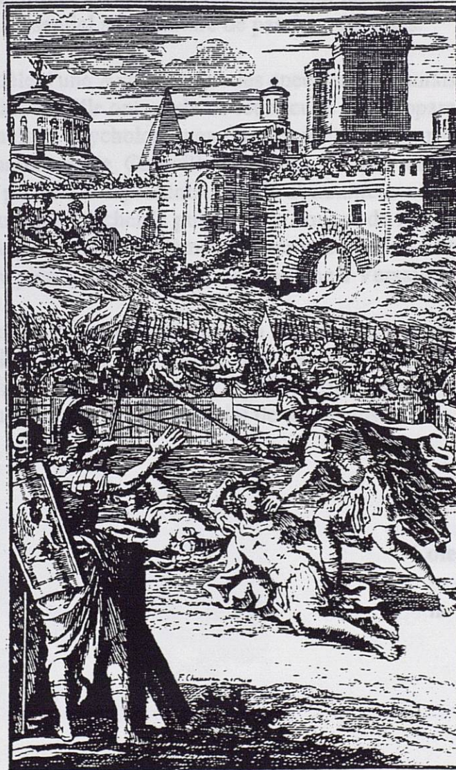
L A THEBAYDE .