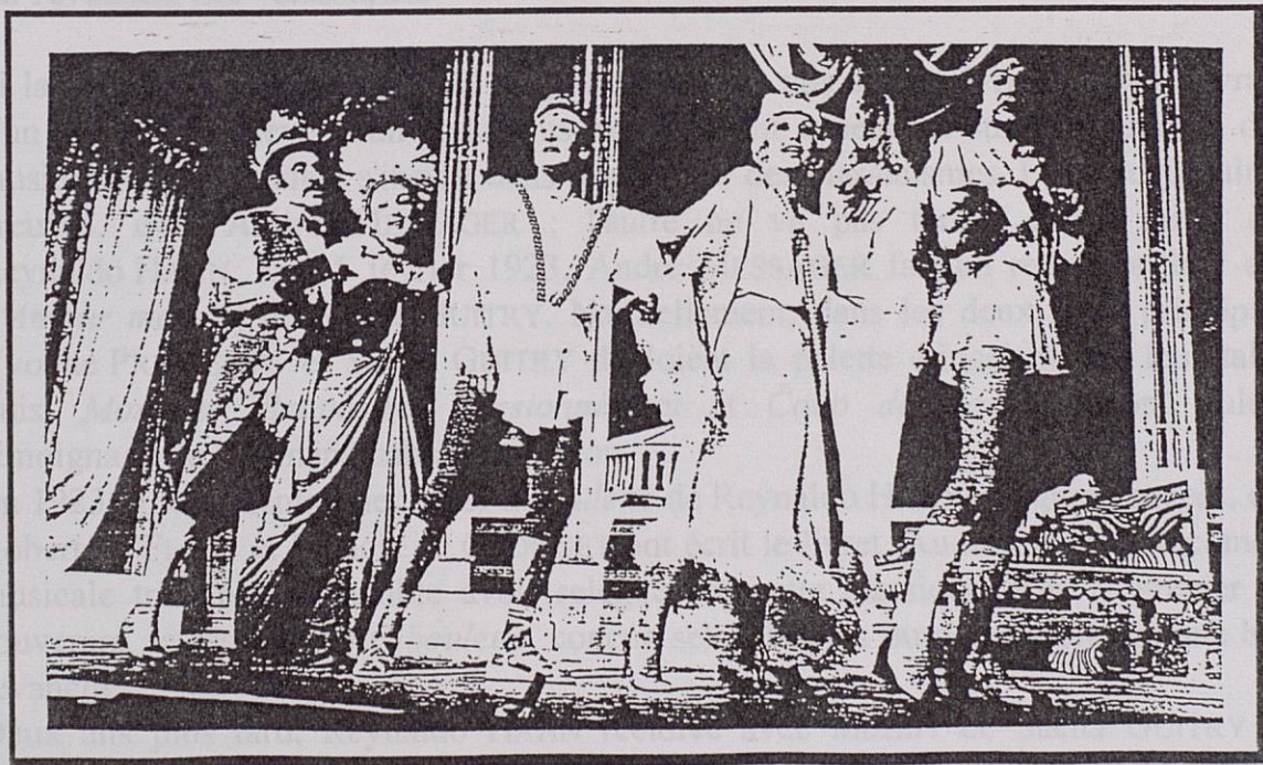
Reprise de Phi-Phi