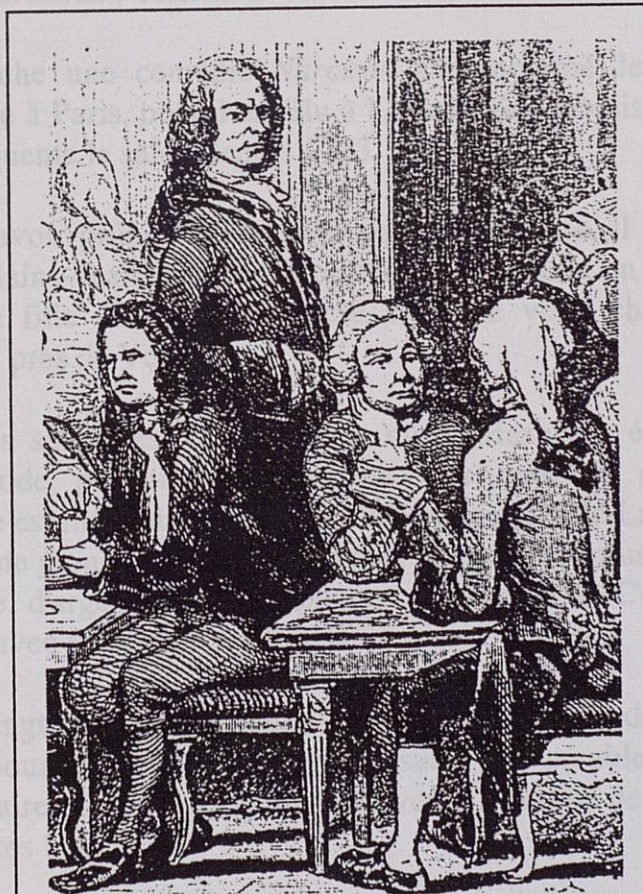
Le café Procope, lieu de rendez-vous des écrivains et des philosophes au XVIII e siècle.

Plus encore que les salons, il fréquente les cafés littéraires où se réunissent souvent les partisans des Modernes. Sa revue, Le spectateur français , qui fait fureur, devait être hebdomadaire mais devient rapidement un mensuel.