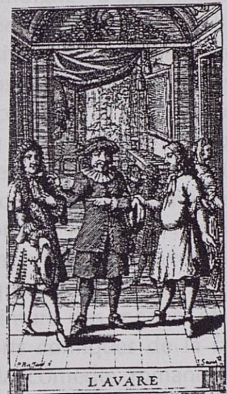
L'Avare, 1668. Molière joue Harpagon

Il assure le délicat équilibre des distributions, ménage les susceptibilités. La silhouette épaisse de MOLIERE, la variété de ses postures et ce que ses contemporains ont appelé sa "scurrilité", qui est un art de la grimace, le prédestinaient à certains rôles : ARNOLPHE, George DANDIN ou HARPAGON.