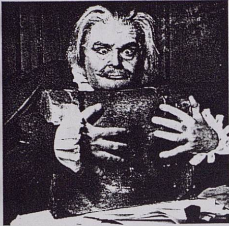
Jean Le Poulain, 1965