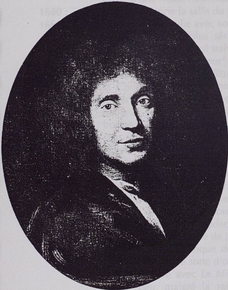
MOLIÈRE, par Mignard