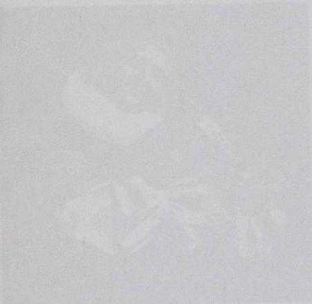
Claude Piequ, 1966