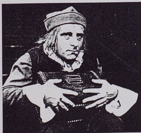
Michel Aumont, 1969