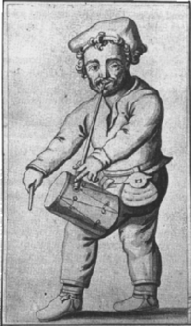
Richard Tarlton, clown élisabéthain (1580)

Le clown était un personnage traditionnel du théâtre élisabéthain. S'il était gaffeur, lourdaud et ridicule, il faisait également preuve de bon sens, et parfois même d'un cynisme proche de celui du bouffon.