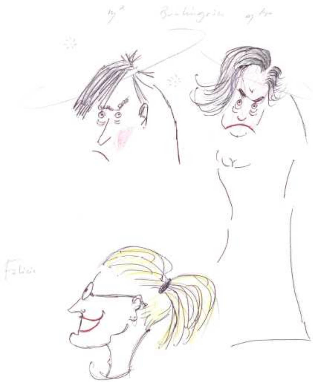
Croquis dessiné par Jean-Louis Benoit