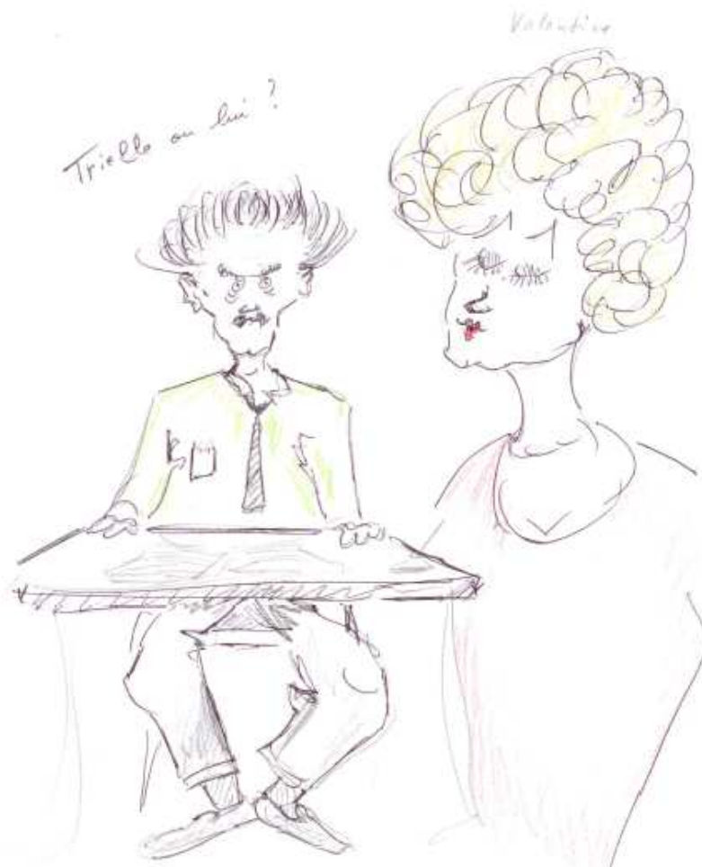
Croquis par Jean-Louis Benoit