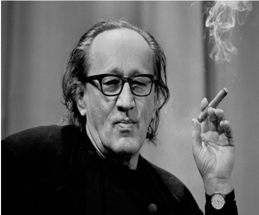
Figure emblématique de la scène théâtrale européenne de la seconde moitié du XXème siècle, Heiner Müller a construit son oeuvre dramatique sur les ruines de l'après-guerre.

Son oeuvre, une vingtaine de pièces, utilise des restes, selon ses propres dires, des textes faits de plusieurs fragments écrits à des époques différentes, mais aussi des résidus d'Histoire et des reliefs de sujet.