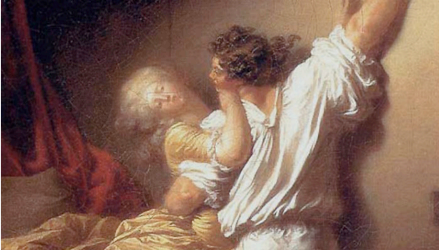
Le Verrou, Fragonard

Laclos a lui-même adapté pour la scène un autre roman épistolaire (adaptation sans succès du roman de Madame Riccoboni, Ernestine (1765) en opéra comique), et il est l'auteur d'un texte de critique littéraire sur le roman théâtral. Il est donc amateur de théâtre et la dynamique du récit des Liaisons Dangereuses en garde la trace.